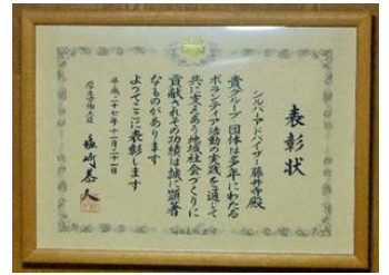
厚生労働大臣表彰状