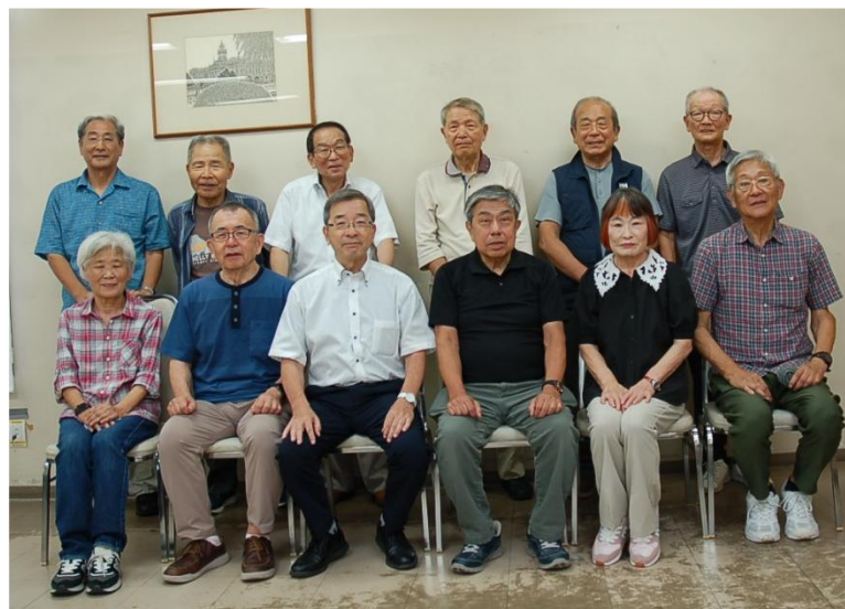
2025年度大阪府シルバーアドバイザー連絡協議会役員

今後とも大阪府シルバーアドバイザー連絡協議会の益々のご発展を祈念いたしまして35周年のお祝いの言葉とさせていただきます。