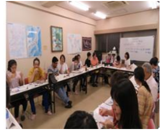
「玉手箱」の手づくりおもちゃ風景