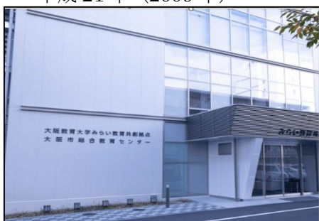
大阪市教育総合センター (大阪市)