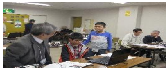
「プログラミング体験」大学教授と実験