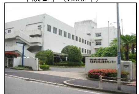
大阪府立老人総合センター (吹田市)