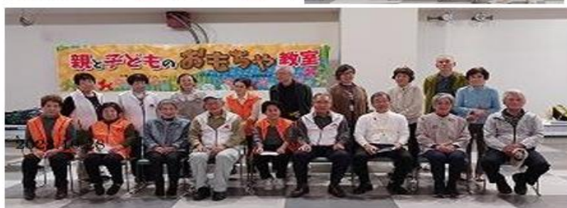
2023/10/28 親子おもちゃ教室 スタッフ