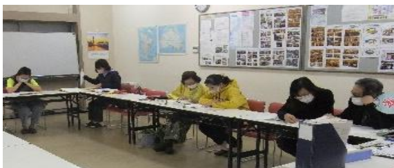
「日本語プラザ教室」風景

今後共楽しみながら、仲間達と和気藹藹とボランティア活動を元気で続けていきたいと思ひます。