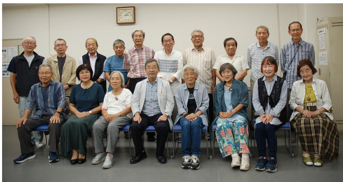
2025年度大阪府シルバーアドバイザー連絡協議会理事